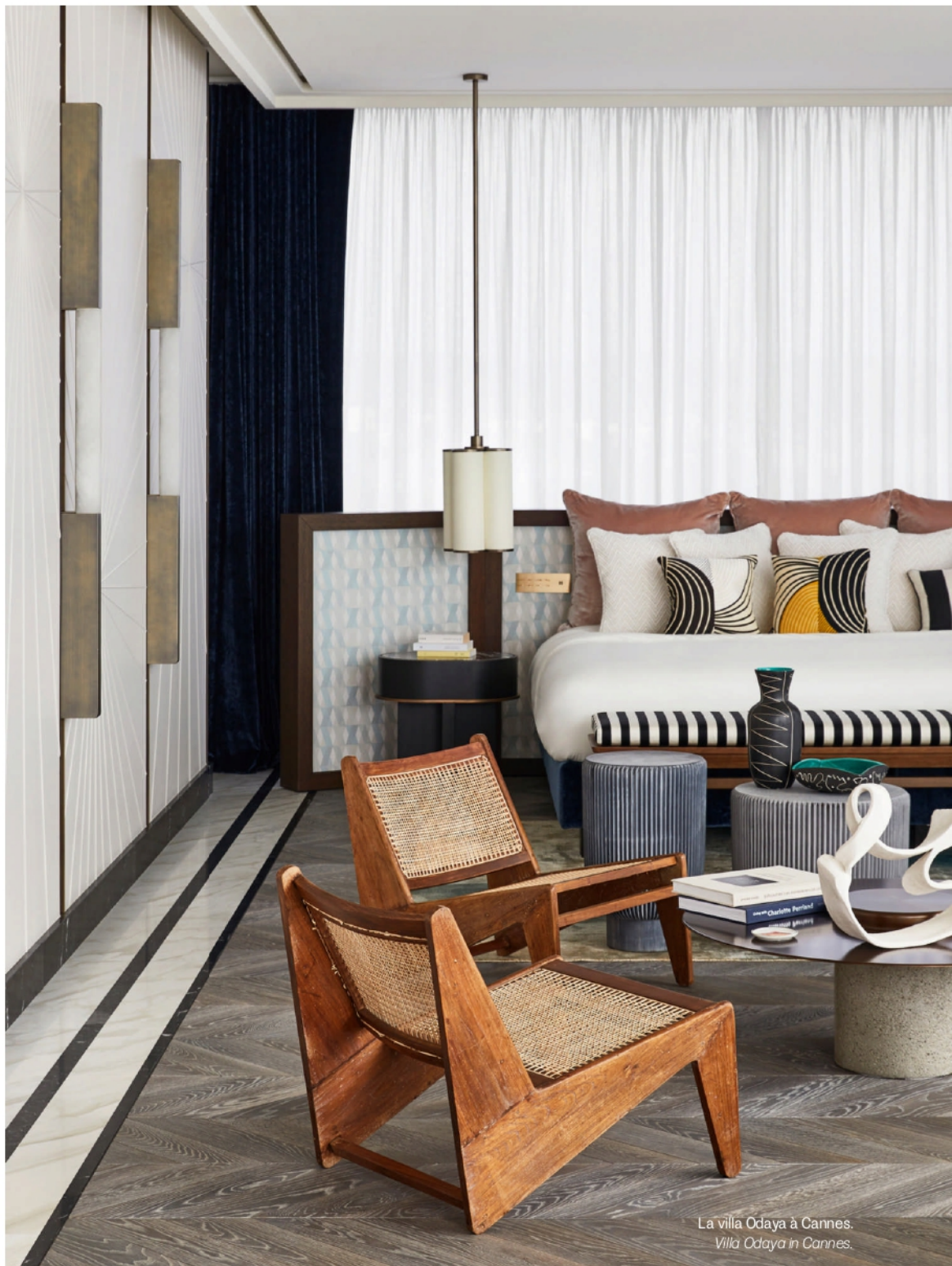
La villa Odaya à Cannes. Villa Odaya in Cannes.