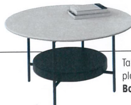
Table basse Madrid, plateau en céramique, BoConcept , 979 €.