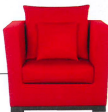
Fauteuil Nielsen, tissu coton et soie, Armani Casa , 5 800 €.