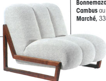
Fauteuil Théodore, en noyer et tissu, Humbert & Poyet , à partir de 5 500 €.