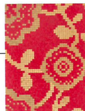
Mosaïque Flower Carpet Red, création Carlo Dal Bianco, Bisazza , prix sur demande.