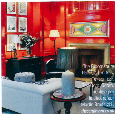
The Bloomsbury Hotel, à Londres, et son bar, The Coral Room, réalisé par le décorateur Martin Brudnizki. thecoralroom.co.uk