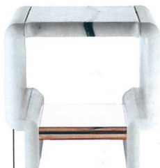
Guéridon So White, en marbre Corciula et cuivre poli, Thierry Lemaire , 9 355,50 €.