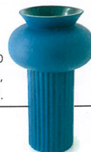
Vase Ionico, création Valerio Sommella, collection CoDe, Calligaris , 144,50 €.