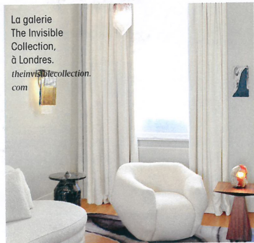
La galerie The Invisible Collection, à Londres. theinvisiblecollection.com