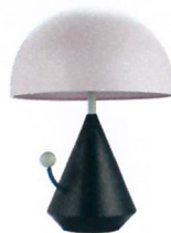
Lampe Dalí Divina, en métal, Maison Dada au Printemps , 558 €.