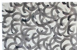
Tissu Vernissage, en lin, Dedar , 143,40 € le mètre en 138 cm de large.