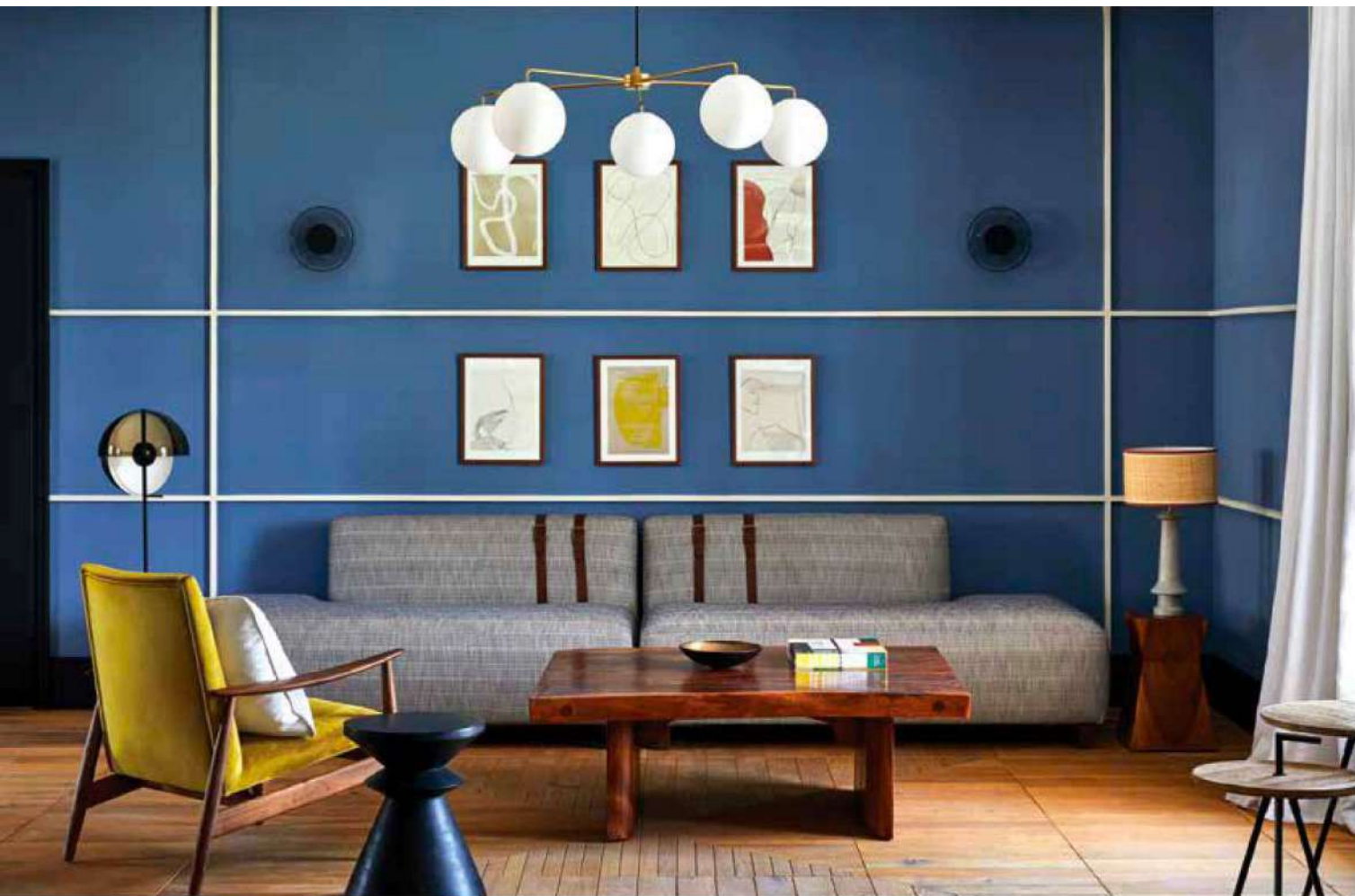
Los espacios interiores de Ultimate Provence fueron decorados por el dúo renombrado de Humbert & Poyet —conocido por diseñar los restaurantes Beefbar, entre otros proyectos—.

Situado a 30 minutos de la famosa pequeña ciudad de Saint-Tropez, en la Riviera Francesa, Ultimate Provence es mucho más que un viñedo de 46 hectáreas, el cual produce el vino rosado Côtés de Provence. Este lugar ofrece una experiencia completa, pues cuenta con un hotel boutique de 15 cuartos, así como otras opciones en renta, que incluyen seis habitaciones, seis estudios y seis departamentos.