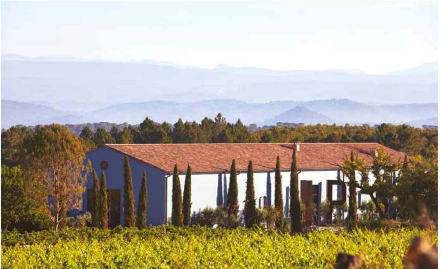
Rodeada de viñedos y olivos, esta propiedad del sur de Francia permite apreciar el estilo de vida provenzal, que invita a disfrutar de momentos apacibles al aire libre.